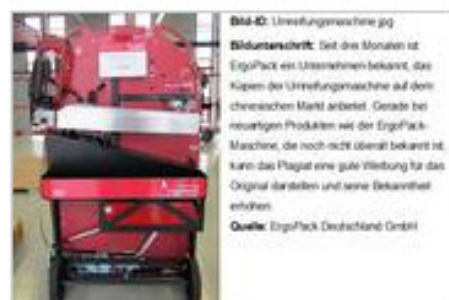
Bild-ID: Umreifungsmaschine.jpg Bildunterschrift: Seit drei Monaten ist ErgoPack ein Unternehmen bekannt, das Kopien der Umreifungsmaschine auf dem chinesischen Markt anbietet. Gerade bei neuartigen Produkten wie der ErgoPack-Maschine, die noch nicht überall bekannt ist, kann das Plagiat eine gute Werbung für das Original darstellen und seine Bekanntheit erhöhen.

Die vom Plagiator kopierte veraltete Version lässt sich bereits äußerlich leicht vom aktuellen Original unterscheiden, was sich am deutlichsten am Verschlusskopf der Maschine zeigt: Beim chinesischen Modell wurde das Akku-Verschlussgerät eines Schweizer Herstellers kopiert, das bei der damaligen Version eingesetzt, mittlerweile aber durch einen integrierten Verschlusskopf ersetzt wurde, der von ErgoPack eigens entwickelt wurde. Von diesem Gerät lässt sich die chinesische Kopie bereits farblich leicht unterscheiden, da sie im Gegensatz zur Eigenentwicklung und zum Rest der Maschine eine blaue Farbe hat. Zudem besitzt die Kopie einen separaten Akku und ist nicht am zentralen Akku angeschlossen wie beim Original. Klar erkennbar ist auch, dass das Plagiat nicht über einen zusätzlichen Band-Cutter verfügt und deutlich zu große Handgriffe hat, die zudem nicht wie beim ErgoPack ergonomisch gestaltet sind. Daneben gibt es kleine Unterschiede, wie zum Beispiel die unterschiedliche Breite des Umlenkschlittens und des Schwenkarms der Bandrolle. Da der chinesische Wettbewerber veraltete Technik kopiert hat, sind auch die Preise der beiden Maschinen nicht vergleichbar.